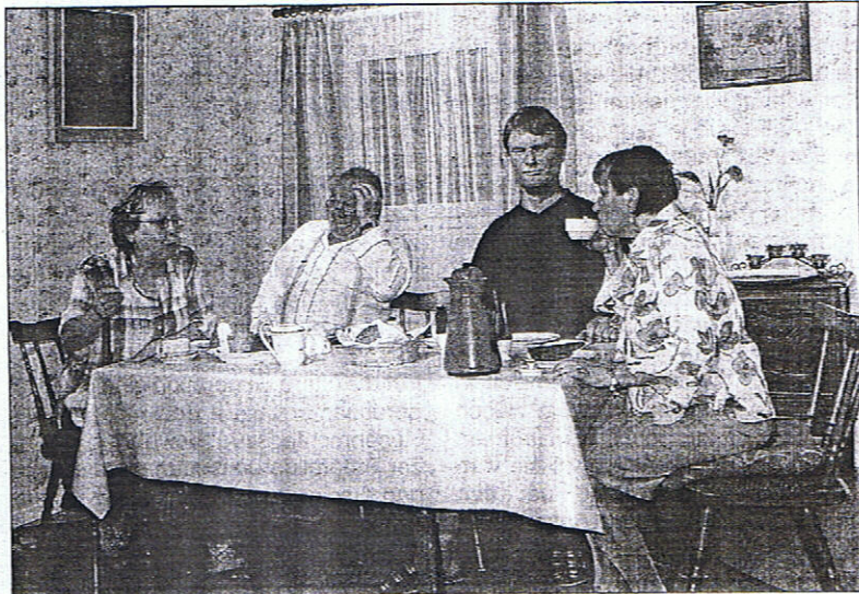
Trügerische Idylle beim Frühstück: Wanda (l.) Fritz und Linda sind nur auf das Erbe von Hugo (2.v.l.) aus.

Die Handlung ist Chaos vom Feinsten: In dem Haus, von dem auf der Bühne nur das Wohn/Eßzimmer zu sehen ist, leben Hugo, dessen Sohn Fritz mit seiner Frau Linda und deren Schwester Wanda, sowie Fritz' und Lindas Sohn Bernd. Der hat eine Freundin namens Doris, die er aus Versehen bei einer Schaumparty geschwängert hat („ich kann nichts dafür, da war soviel Schaum“). Auch Hugo hat eine Freundin, die reife, aber noch sehr fesche Gerda. Er und sein Sohn stehen unter der Fuchtel von Linda, die darin von ihrer etwas schlampigen Schwester unterstützt wird. Hugo rächt sich, indem er – zum Auftakt des Stücks – als Erster am Frühstückstisch Zucker in die Milch kippt, Salz in die Zuckerdose, Asbach in die Kaffeekanne und den Inhalt seines Nachtopfs auf Lindas